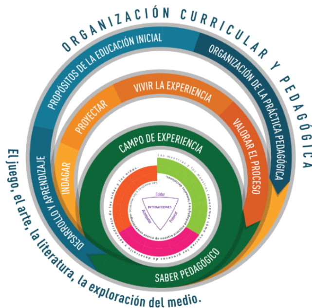
Figura 1. Organización curricular y pedagógica. Tomado de Bases curriculares para la educación inicial y preescolar.

En los documentos institucionales, Plan de aula y Planeación de clase, se evidencia a través del trabajo por proyectos en cada una de sus fases los elementos de la práctica pedagógica y la implementación de las actividades rectoras.